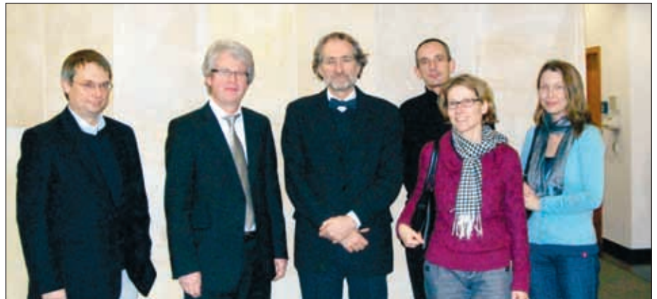
Arbeitskreis-Sprecher und Richter